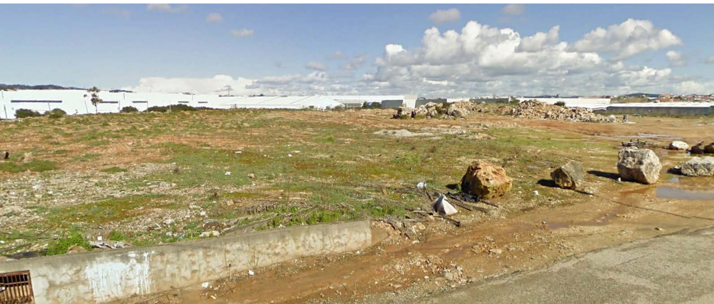
Vista do terreno a partir da via circundante

Para mais informação, por favor contacte: